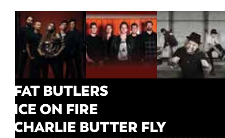
KONCERT Veliki oder — Kočevje 1. julij — 20:00