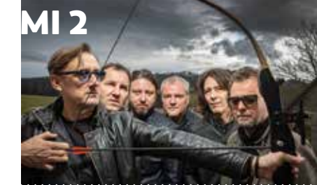
KONCERT Veliki oder — Kočevje 7. maj — 20:00

Zbirno mesto: KCK (TZO 62) Začetek/trajanje: 9.00/8 ur Cena: 60 €/osebo Doplačila: escape room na Gradu Kostel (15 €/osebo) Doživetje: Obisk Kostela z ogledom Slapa Nežica in predstavitvijo zgodbe o deklici Nežici, ogledom Gradu Kostel, okusnim domačim kosilom na lokalni domačiji in zabavno igro na igrificirani kmetiji, Lukčevi domačiji.