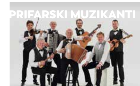
KONCERT Veliki oder — Kočevje 3. junij — 20:00