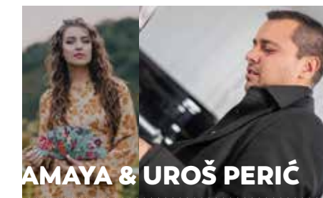
KONCERT Veliki oder — Kočevje 9. julij — 20:00