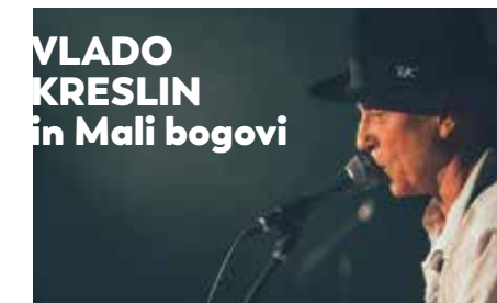
KONCERT Veliki oder — Kočevje 27. maj — 20:00