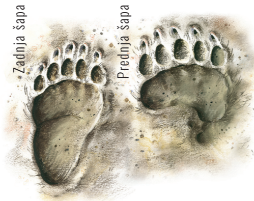
Ilustracija: Igor Pičulin

Ob srečanju z medvedom je najbolj pomembno, da ostanemo mirni in presodimo situacijo. Naslednji koraki se razlikujejo glede na okolišnice srečanja.